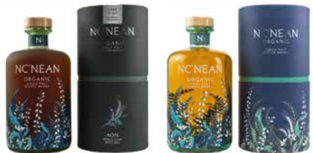
MC' NEAN Aon (links), Batch 14 (rechts)