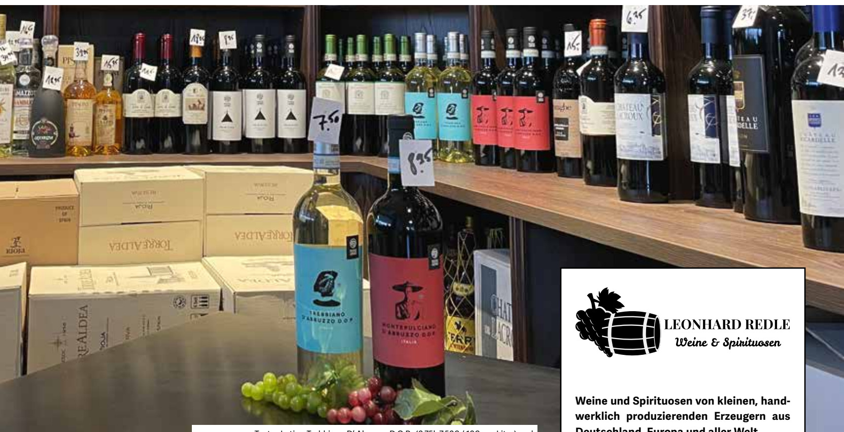
Teatro Latino Trebbiano D' Abruzzo D.O.P. (0,75l, 7,50€ / 10€ pro Liter) und Montepulciano D' Abruzzo D.O.P. (0,75l, 8,95€ / 11,93€ pro Liter) Preise inkl. 19% MwSt.