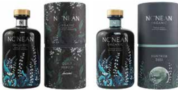
MC' NEAN Quiet Rebels Annabel (links), Huntress Spring 2022 (rechts)

Die MC' NEAN Destillerie liegt auf der Morvern Halbinsel im Westen der Highlands und wurde erst im März 2017 eröffnet. Ihr Name MC' NEAN ist eine Abkürzung von Neachneohain, einer Geisterkönigin aus gälischen Legenden, und wird „Nook-knee-ane“ ausgesprochen.