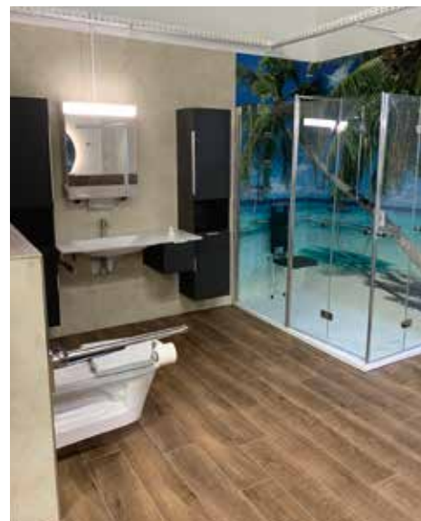
Strandfeeling statt Fliesen: Dieses Bad ist eine echte Wohlfühloase und dank unterfahrbarem Waschtisch und viel Platz kommt man hier auch mit Rollstuhl gut zurecht.

SHL BADWELT NIEDERRHEIN Alsstr. 268 | 41063 Mönchengladbach | (02161) - 827 35 58 info@shl-badwelt.de | www.shl-badwelt.de